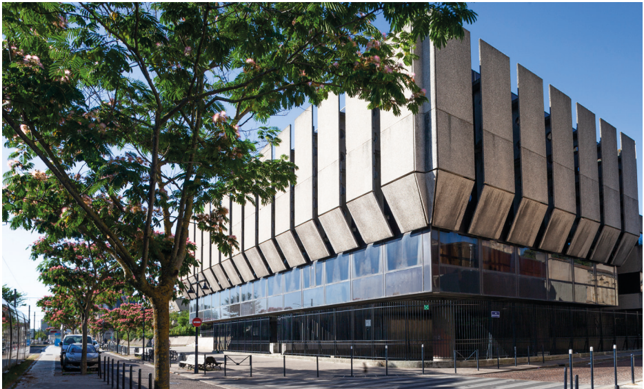
Le Conservatoire de Bordeaux quai Sainte-Croix

Ce livret d'accueil s'adresse à toute personne non encore inscrite au Conservatoire de Bordeaux, débutante ou non, qui souhaite obtenir les premières informations sur les pratiques possibles et les enseignements proposés.